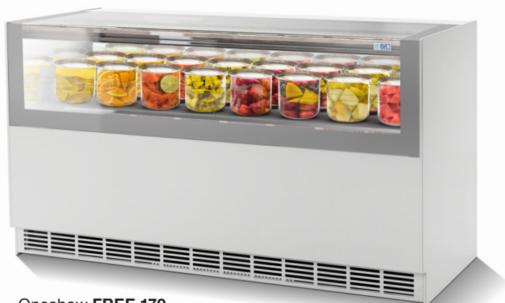
Oneshow FREE 170